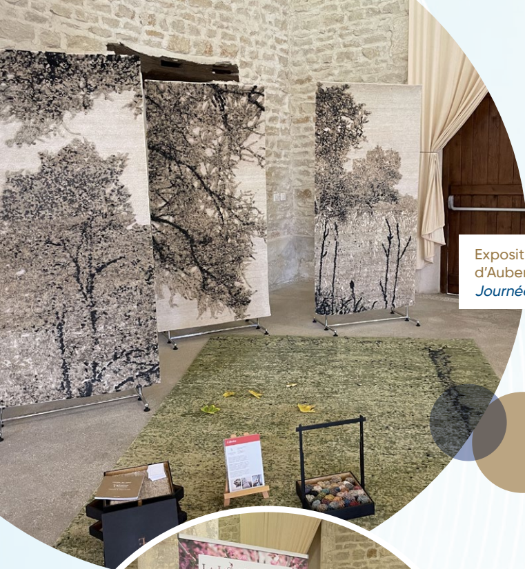
Exposition collective à l'Abbaye d'Auberive (52) Journées Européennes du Patrimoine