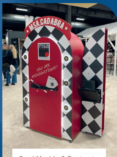
EspritMeuble & Contract à Paris

Exposition collective au Salon EspritMeuble à Paris