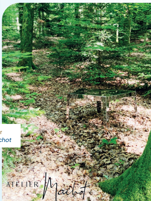
Table Miroir Atelier Machot

FACE AUX ENJEUX DE TRANSFORMATION DU SECTEUR, MADEIN GRAND EST SE POSITIONNE COMME UN SOUTIEN ESSENTIEL POUR LES ENTREPRISES, LES AIDANT À ANTICIPER ET À RELEVER LES DÉFIS LIÉS AUX ÉVOLUTIONS DU MARCHÉ.