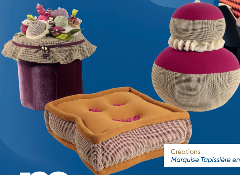
Créations Marquise Tapissière en Sièges