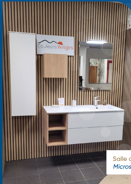
Salle de bains Epilobe Microserie