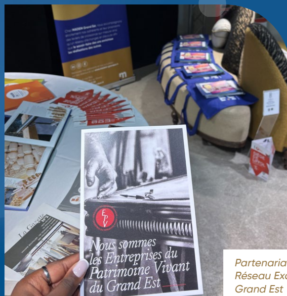
Partenariat EPV Réseau Excellence Grand Est et Madeln Grand Est