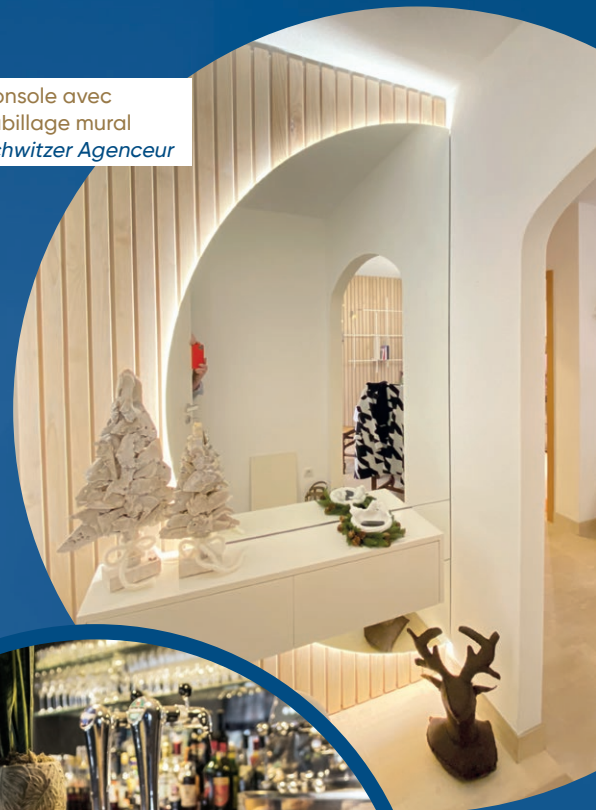
Console avec habillage mural Schwitzer Agenceur

Plus qu'un simple regroupement, MadeIn Grand Est est un accélérateur d'opportunités, un facilitateur de synergies et un levier pour la compétitivité des acteurs du secteur.