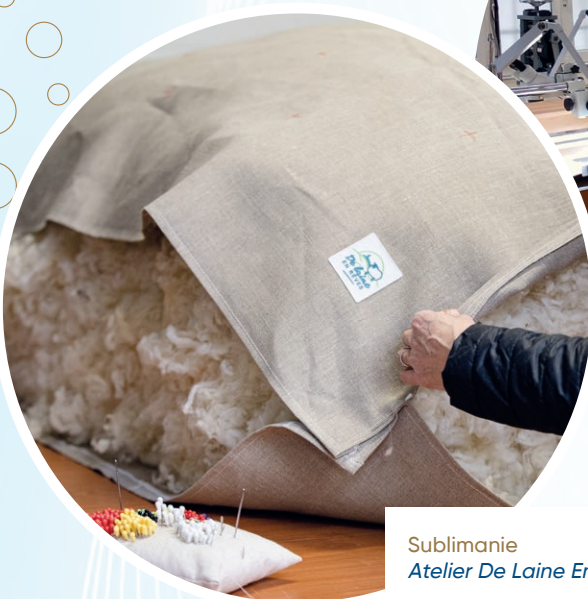
Sublimanie Atelier De Laine En Rêves