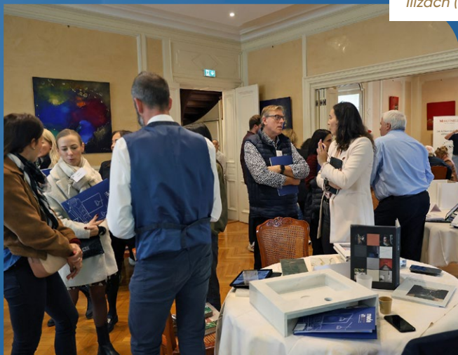
Begin'Event à Illzach (68)

Exposition collective à l'Abbaye d'Auberive (52) pendant les Journées Européennes du Patrimoine et signature d'une convention de partenariat avec le Réseau Excellence des EPV du Grand Est