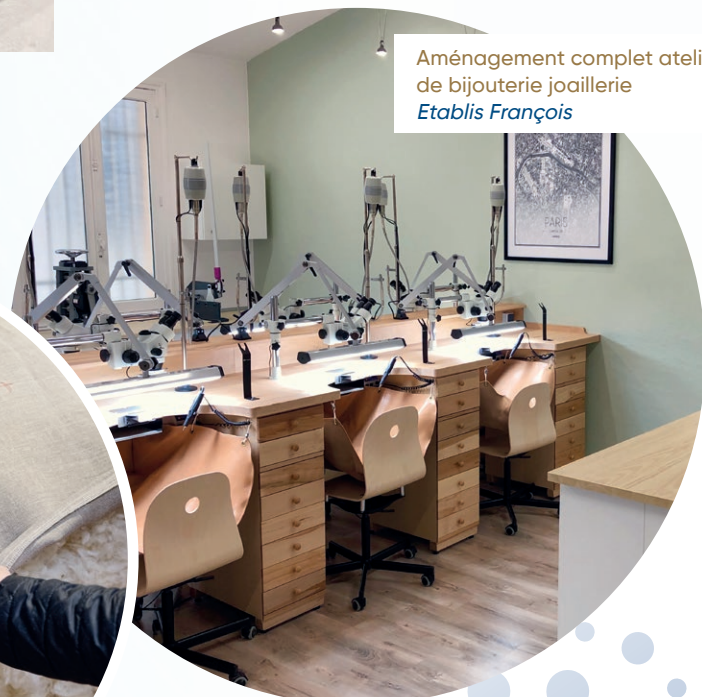
Aménagement complet atelier de bijouterie joaillerie Etablis Français