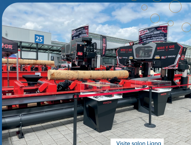
Visite salon Ligna à Hanovre