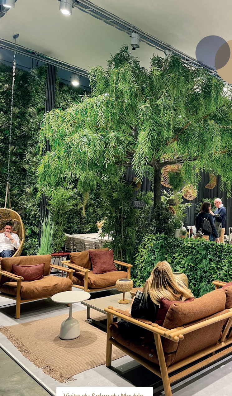
Visite du Salon du Meuble Milan 2025

Les guider vers une production innovante et écoresponsable, à mener une veille sur des nouveaux composants plus vertueux, sur des composants biosourcés et recyclés, à analyser le cycle de vie de leurs produits et à réduire leur empreinte carbone.